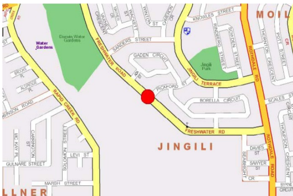
Immagine 1:2 Feathers Sanctuary 49A Freshwater Road Jingili