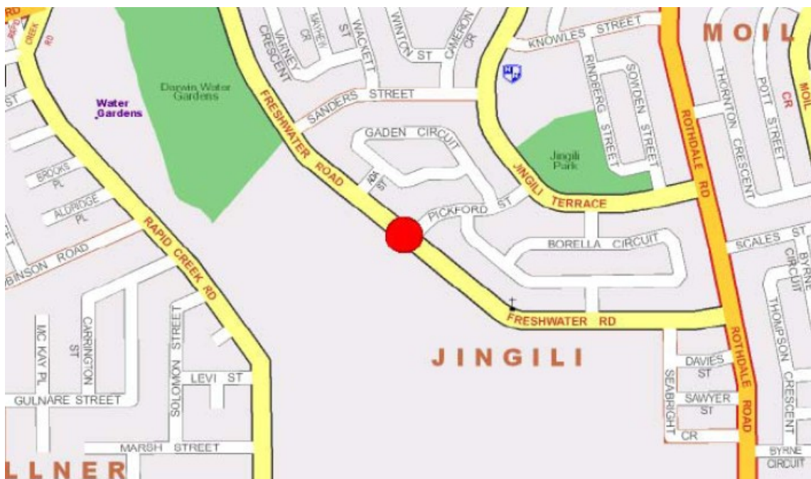
Figure 1.2 Feathers Sanctuary 49A Freshwater Road Jingili